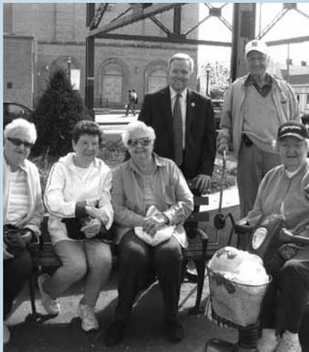
Council Member Van Bramer spoke with Woodside residents in Carl Sohncke Square and listened to neighborhood concerns. El Concejal Van Bramer habló con residentes del vecindario de Woodside en Carl Sohncke Square y escuchó sobre sus preocupaciones.

En la audiencia pública de MTA en Queens, Jimmy nos defendió y exigió que MTA no eliminara ninguna ruta de autobús, y que siguiera ofreciendo servicios gratuitos de Access-A-Ride y MetroCard para estudiantes.