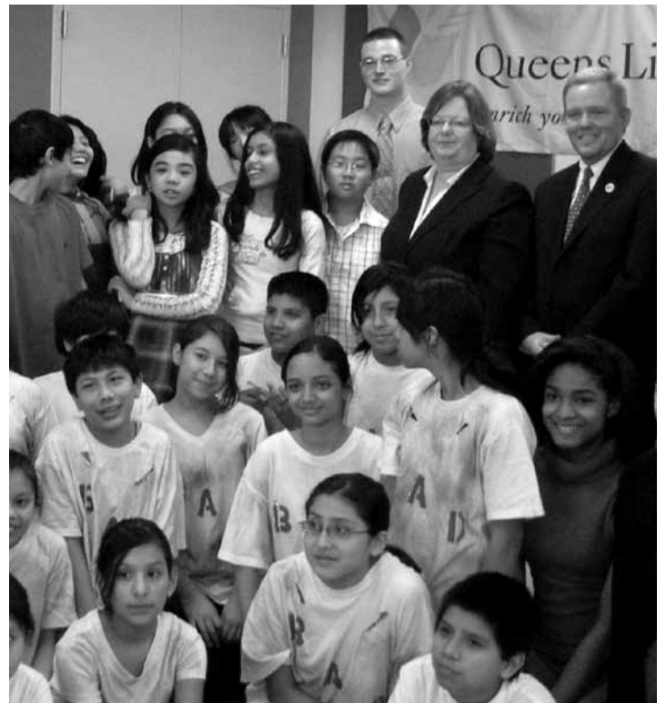
Council Member Van Bramer attended Sunnyside Library's re-opening after a $2.3 million renovation added computers and a teen area. Renovation funds were secured by Assemblywoman Cathy Nolan and Queens delegations to the State Assembly and City Council. El Concejal Van Bramer asistió a la reapertura de la Biblioteca de Sunnyside después de una renovación de $2.3 millones en la cual se añadieron computadoras y un área para adolescentes. Los fondos de la renovación fueron asegurados por la Asambleísta Cathy Nolan y delegaciones de Queens en la Asamblea Estatal y el Concejo Municipal.